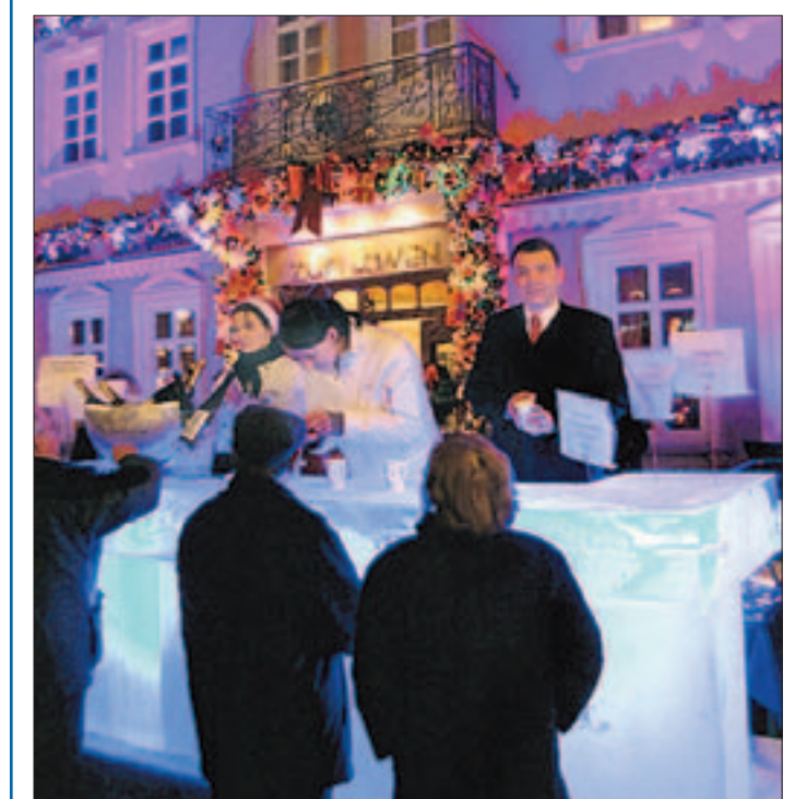
Kühler Tresen: Vorm „Löwen“ gab es Eis in Blöcken.

Edel, edel: Passend zur Eisbahn konnten sich die Besucher der Eisrevue gestern an eisiger Stelle laben. Zwei Eisbars waren vorm Hotel „Zum Löwen“ aufgebaut. Wie am Nobel-Hotel Adlon in Berlin ging es auf der Marktstraße zu. An echten Eisklötzen, entsprechend beleuchtet, wurden leckere Getränke serviert.