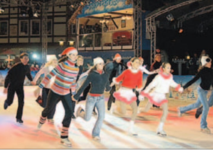
Tolle Talente: Vielversprechender Nachwuchs vom SC Berlin.

Vor drei Großbildleinwänden tummelten sich zahlreiche Duderstädter, um Kati Witt und die anderen Stars möglichst nah zu erleben. Auch ein weiterer Geheimtipp blieb nicht lange unentdeckt: Im Modehaus E&R war ebenfalls eine große Leinwand aufgebaut, wo alle Interessierten das Geschehen auf der Eisfläche hautnah und im Trockenen genießen konnten: