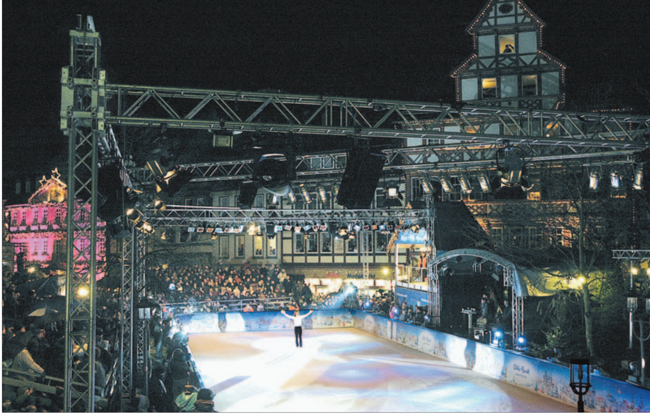
Wintermärchen-Traum in Duderstadt: Weltstar Katarina Witt und ihre Show „Christmas on Ice“ sorgten vor festlich illuminierten Häusern für einen Abend der Superlative an der Brehme.