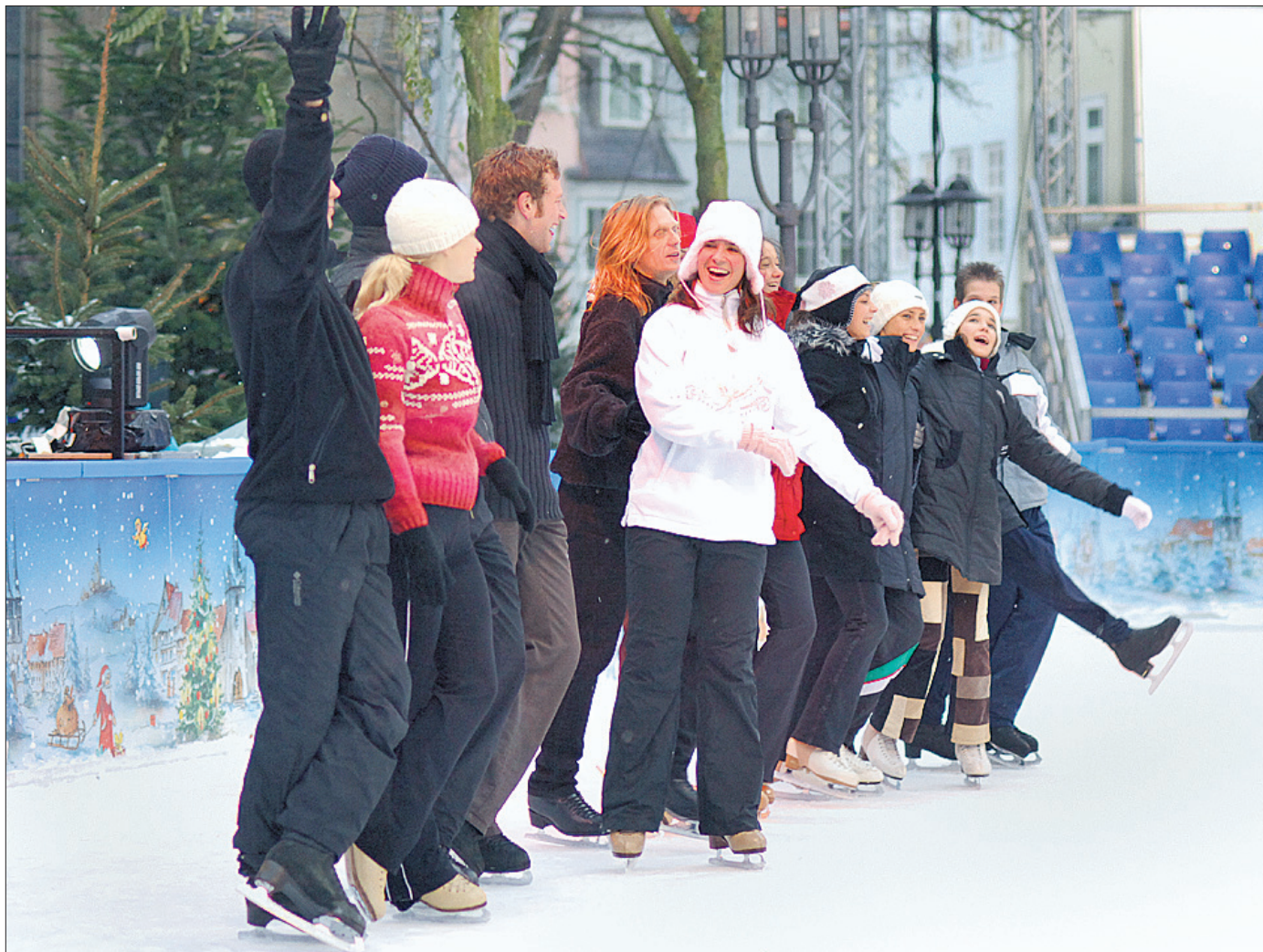
Mitten in Duderstadt: Schon bei den Proben vor der Revue hat Katarina Witt (M.) sichtlich viel Spaß auf der Eisfläche.